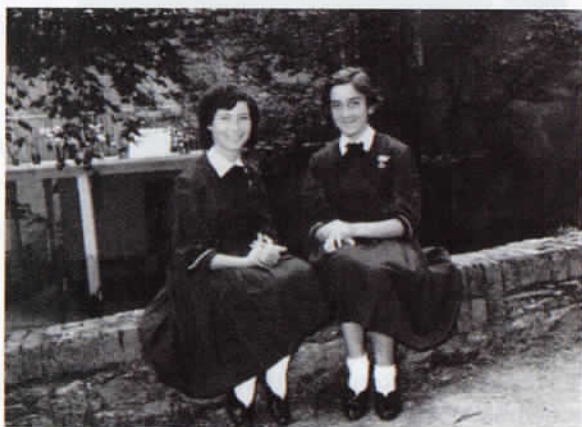
Le piccole donne crescono.

Il Signor Presidente della Repubblica, On. Giorgio Napolitano, grande stimatore della nostra Forza Armata, con suo Decreto " motu proprio " ha recentemente insignito della Croce di Cavaliere dell'Ordine al Merito della Repubblica Italiana 14 benemerite e valorose Mamme, tutte di eccezionale esemplarità nell'aver educato i propri ragazzi e 6 Orfani, che, nella vita, hanno avuto particolari affermazioni professionali.