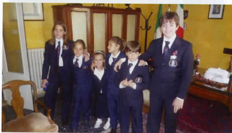
2 novembre 2008 - Convocati a rapporto dal Presidente.