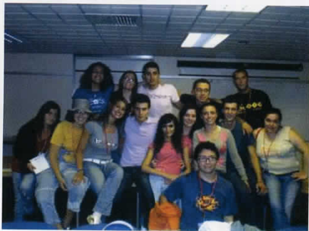
2008 – Vacanza di studio a Bristol (Gran Bretagna)