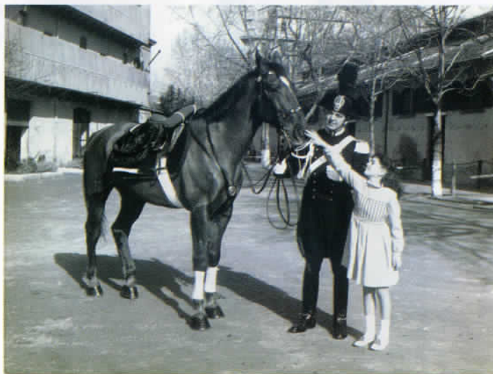
Primo avvicinamento al cavallo "Tartarino".