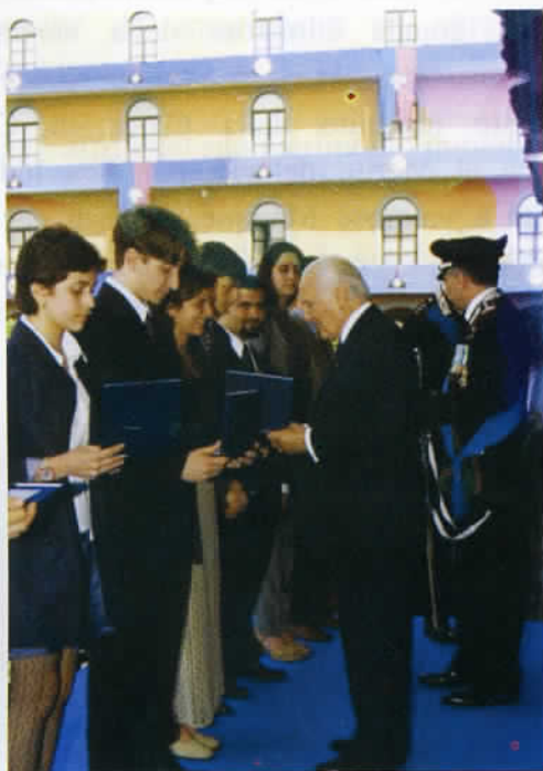
1997 - Il Presidente della Repubblica Oscar Luigi Scalfaro premia i vincitori di un Concorso Letterario dell' O.N.A.O.M.A.C.

Nei suoi sessanta anni di vita l'Opera ha visto passare nei suoi ruoli oltre 30.000 giovani, di cui circa 13.000 nei Collegi e negli Istituti convenzionati.