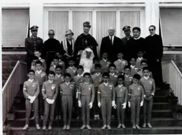
La prima cerimonia di Cresima nel Collegio maschile del "Calambrone di Pisa".