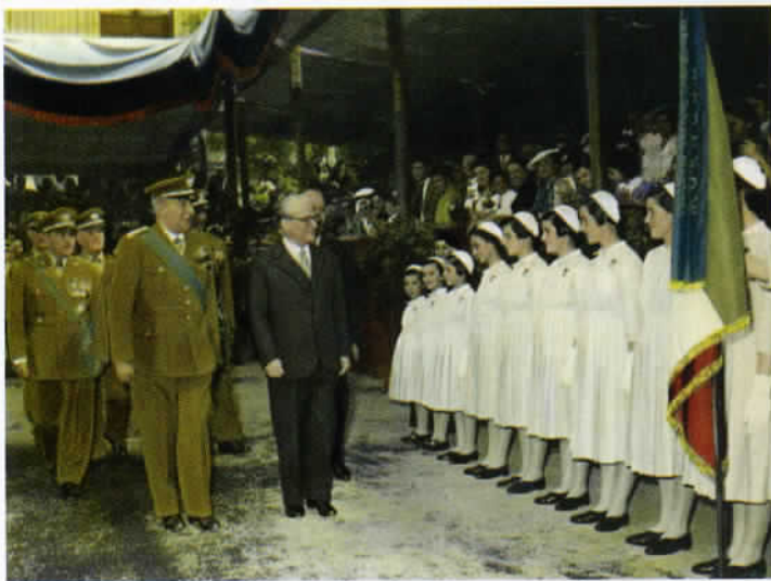
Il Presidente della Repubblica Giovanni Gronchi passa in rassegna le Ragazze del Convitto di Mornese (AL).

Un gruppo di Ufficiali dello Stato Maggiore del Comando Generale, diretti dal Generale di Divisione Alfredo Ferrari e dal Colonnello Romano dalla Chiesa, all'epoca Capo di Stato Maggiore dell'Arma, dopo aver studiato e vagliato le varie implicazioni che il delicato problema comportava, pervennero alla decisione di creare un Ente che provvedesse alla realizzazione di particolari istituti per raccogliere subito i giovani in situazioni di particolare difficoltà e, nel contempo, di assicurare a tutti, con "assegni di studio" da corrispondere alle famiglie, l'opportunità di poter completare l'iter scolastico prescelto.