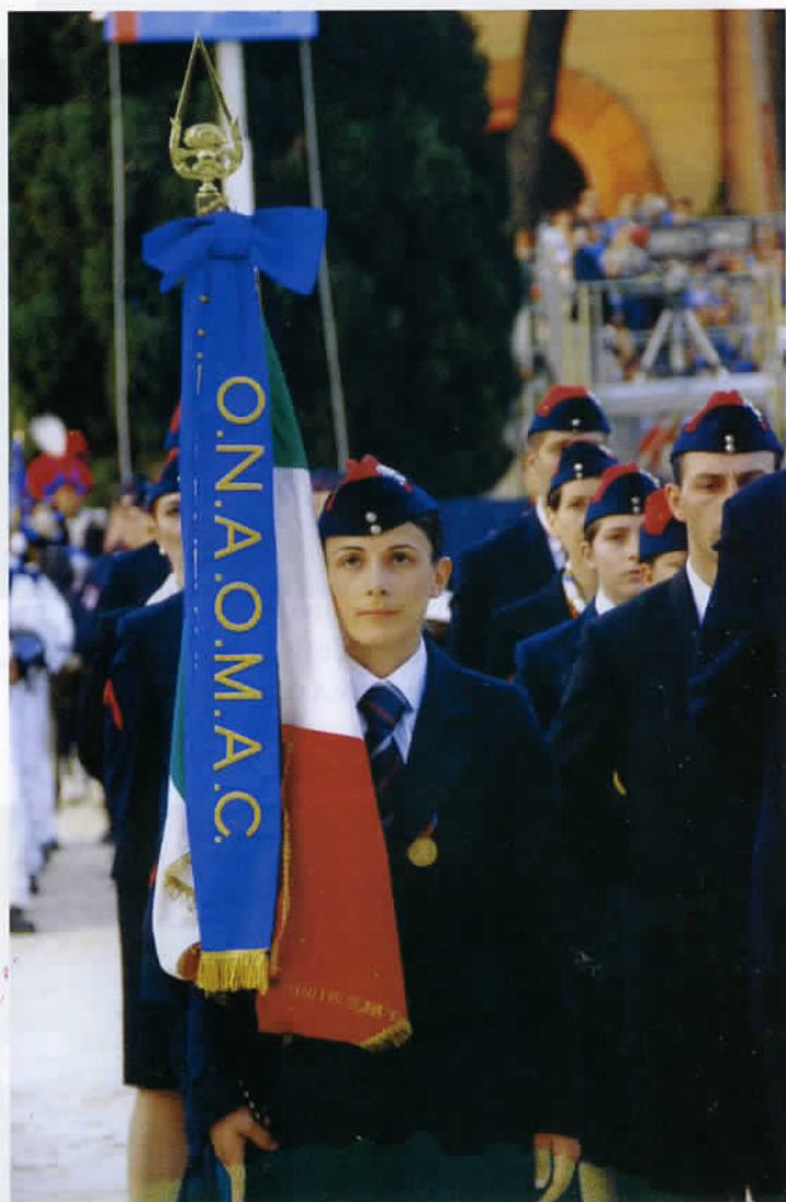
5 giugno 2010 – Festa dell'Arma a Piazza Siena Con la bandiera dell'O.N.A.O.M.A.C.