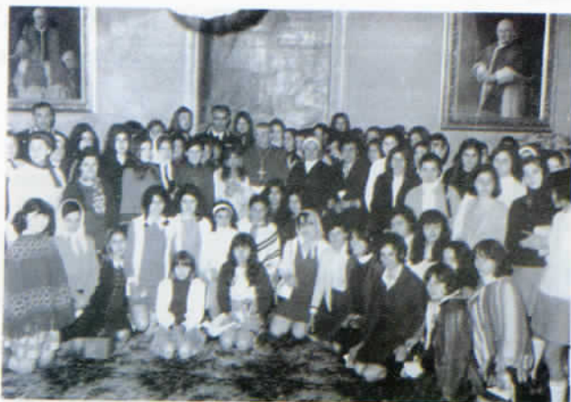
Le convivitrici del Collegio femminile di Roma vengono ricevute in udienza dal Patriarca di Venezia S. Em.za Mons. Albino Luciani, futuro Sommo Pontefice Giovanni Paolo I.

Fu raccolta in tempi brevissimi la rilevante somma di oltre quaranta milioni di lire, con la quale, dopo aver avviato le procedure per l'istituzione della nostra Opera, fu acquistato un complesso residenziale in San Mauro Torinese (TO), sulle pendici del Colle di Superga.