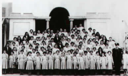
Le prime convittrici del Collegio di Mornese (AL).

Dopo aver provveduto ad accelerare al massimo, anche con acconti, il trattamento pensionistico di reversibilità, emerse la doverosa necessità di assicurare, ai nostri giovani ragazzi, la possibilità di poter svolgere regolari corsi di studi per potersi