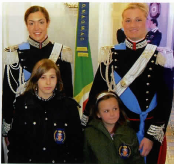
Due generazioni a confronto.