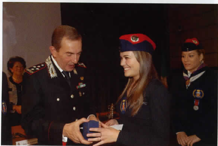
2009 – Il Comandante Generale, Gen. C.d'A. Leonardo Gallitelli, premia una giovane allieva dell'O.N.A.O.M.A.C.