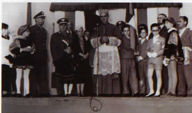
Il Cardinale Giovan Battista Montini, futuro Sommo Pontefice Paolo VI, inaugura il nostro Collegio di Busnago (MI).

Successivamente, furono stipulate altre convenzioni in varie città d'Italia, con rinomati e prestigiosi Collegi, prevalentemente gestiti da Ordini Religiosi, e, nel 1965, durante la Presidenza del Generale di Corpo d'Armata Romano dalla Chiesa, fu acquistato un altro grande complesso residenziale nella pineta del "Calambrone di Pisa", ove furono costruiti altri due grandi Istituti: uno per i ragazzi e l'altro per le ragazze.